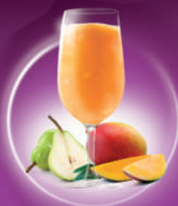
Caipifruta MANGO Y PERA MANGO & PEAR & VODKA