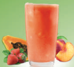
Smoothie Peach Paradise Melocotón, papaya y fresa Peach, papaya and strawberry