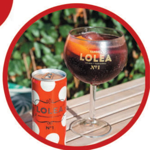
Lolea N°1 lata de 0,25L