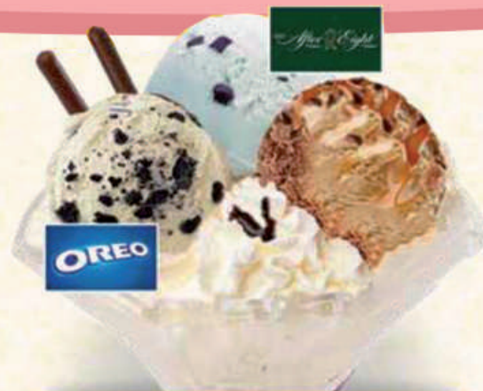
6,00 € Copa Manzanares

Helado de fresa, vainilla y chocolate Strawberry, vanilla and chocolate ice cream