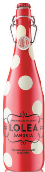
Lolea N°1 0,75L