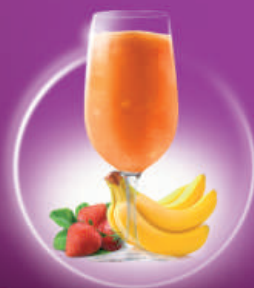
Mediterranean Party PLÁTANO, FRESA BANANA, STRAWBERRY & COINTREAU