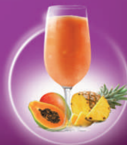
Canarian Sunset PIÑA, PAPAYA, MANGO PINEAPPLE, PAPAYA, MANGO & RON / RUM

Elaborados con trozos de fruta natural / Made with fruit pieces