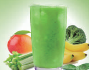
Smoothie Natural Green Brocoli, espinacas, apio, plátano, piña y mango Broccoli, spinach, celery, banana, pineapple and mango