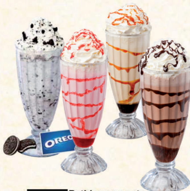
5,00 € Batidos con nata (sabores a elegir)

Helado Oreo con trocitos de galleta Oreo Oreo ice cream with Oreo cookie bits