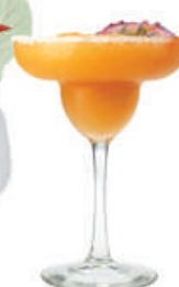
Fruta de la Pasión