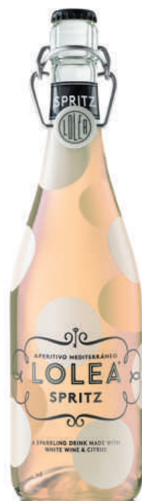
Lolea Spritz Rosé 0,75L