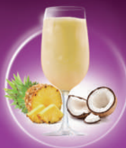
Piña Colada PIÑA, COCO PINEAPPLE, COCONUT & RON CON COCO / RUM WITH COCONUT