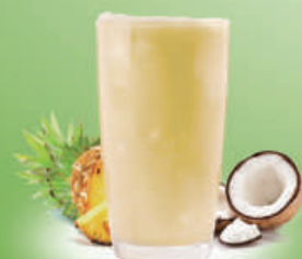
Smoothie Piña Colada Piña y coco Pineapple and coconut