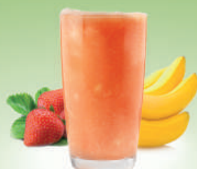
Smoothie Red Banana Fresa y plátano Strawberry and banana