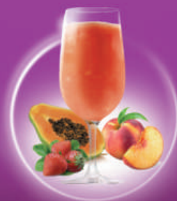
Summer Romance MELOCOTÓN, PAPAYA, FRESAS PEACH, PAPAYA, STRAWBERRIES & GINEBRA / GIN