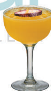
Fruta de la Pasión