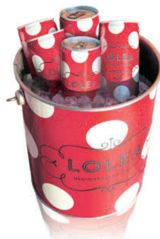
Lolea N°1 5 latas de 0,25L