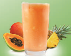
Smoothie Tropic Mix Piña, papaya y mango Pineapple, papaya and mango

Elaborados con trozos de fruta natural Made with fruit pieces