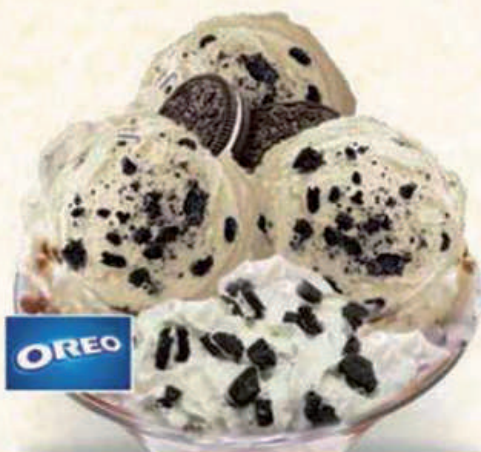
6,00 € Copa Oreo

Helado de after eight, Lion y Oreo After eight, Lion and Oreo ice-cream