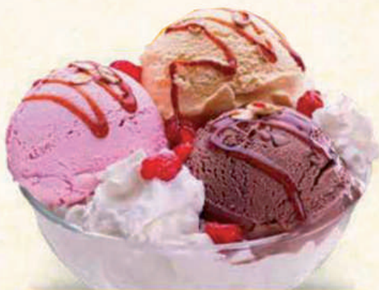
6,00 € Copa Madrid Río

Helado de fresa, vainilla y chocolate Strawberry, vanilla and chocolate ice cream