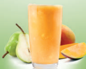
Smoothie Mango Fresh Mango y pera Mango and pear