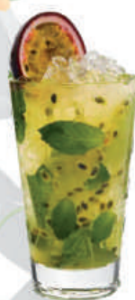
Fruta de la Pasión